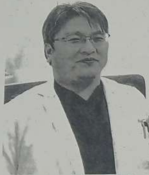
石丸院長